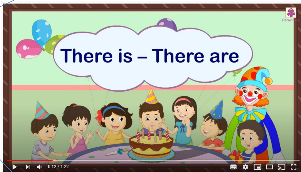
There Is - There Are | Grammar Grade 1 | Periwinkle

https://www.youtube.com/watch?v=HGeuA4iJ8vI