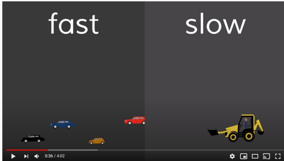
The Opposites Song

https://www.youtube.com/watch?v=HGeuA4iJ8vI